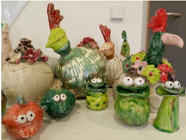
Foto 3: Keramikunikate aus den Tageswerkstätten warten auf ihren Einsatz als Blickfang für drinnen und draußen.