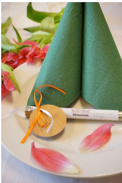
Foto 4: Machen den Ostertisch zur Festtafel: Frühlingsfrische Dekoideen der Lebenshilfe Hartberg!