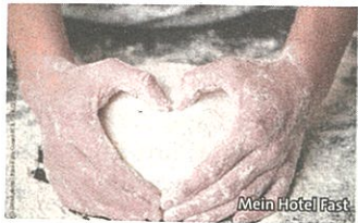
Mein Hotel Fast

Rund geht's wieder bei den traditionellen Knödelwochen im Mein Hotel Fast in Wenigzell. Von 12. bis 27. Jänner 2019 können Sie so viel Knödel essen wie Sie wollen und sich von den unterschiedlichsten Variationen, die auf den Tisch gezaubert werden, begeistern lassen. Reservierungen unter +43 3336 2202. Mehr Informationen unter www.hotel-fast.at